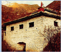
The "Temple Of Miraculous Fire" at Muktinath, Nepal. Photo by Ken Street (November 1979).

[For more on this subject, please read our tract The Temple Of Miraculous Fire. ]